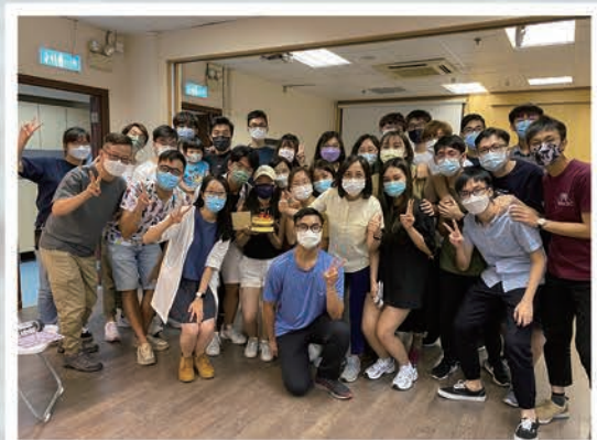
●屯門堂比撒列團契約20位去年考DSE的弟兄姊妹積極參與福音工作

假如四年前我不願意順服上帝的引導，放下別人眼中的高薪厚職，走出我的安舒區？假如在疫情下我被懷疑和信主引導，在很多人看為「不得時」的處境放棄，我將無法經歷上帝奇妙的工作。