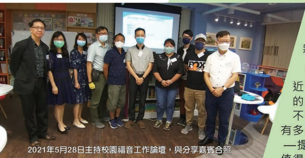
2021年5月28日主持校園福音工作論壇，與分享嘉賓合照

雖然我服侍的機構只有我和另外一位同工，在2017至2018學年期間，總共負責了52次聚會。我們舉辦學生領袖培訓10次，共接觸550人；舉辦老師培訓/退修聚會13次，共接觸560人；舉辦教牧/信徒領袖及信徒分享8次，共接觸810人；舉辦福音聚會11次共接觸2800人，超過320人決志。在一年多的時間，我們接觸人數高達4000人。