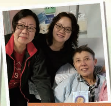
康復後幫助有需要的人