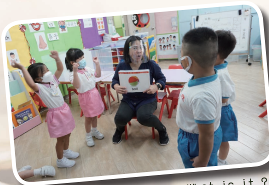
What is it?