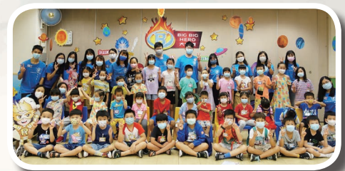
暑期聖經班大合照

感謝神的祝福，讓教會順利舉辦一連四天的暑期聖經班，超額收了38位學生，當中大部分小朋友都得聞福音和決志信主，暑聖過後有小部分仍返兒童崇拜。