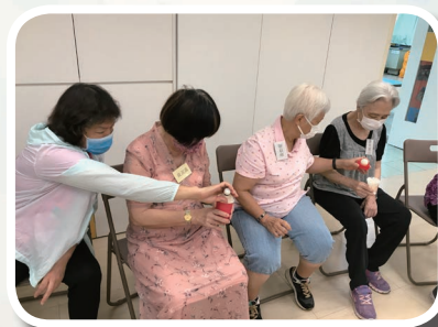
長者遊戲日暨生日會