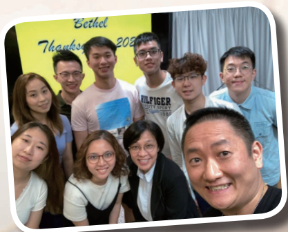
伯特利小組感恩會