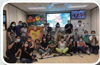
約翰團 31 周年感恩會

寶林堂 31 周年「情・意・結」感恩會（4/7）表達情繫寶林，同心合意，結連於主！先有不同團契群組先呈獻感恩，當天再次彰顯 神是超越和信實的，祂的意念高過我們的意念！ 神預備利未牛服侍（長執、董事、司庫、各部、各團及託管小組同工）， 神尋找迷失羊回家（親友、託管生及社區人士）， 神興起福音鴿傳揚救恩（佈道人、傳道者和宣教士），細數主的恩惠真叫我們驚訝又歡呼！