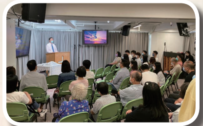
教會裝修後首次復會

這不只是一個普通的裝修，卻是在神家裏眾肢體作好恩賜、才幹配搭的預備，齊心合力建設神家。這不就是正正我們教會年題：作無愧工人 2.0 - 「人人事奉·發揮恩賜」實踐的好機會嗎！堂會新的擺設、新的安排，願主使用，叫福音廣傳。當 4 月 25 日堂會首次的直播，5 月 2 日裝修後首次復會，全教會十分感動，我們珍惜這一切成果，向神獻上感恩，頌讚聲及禱聲不絕。是神在我們當中，一切都在祂的時間當中，In HIS time !