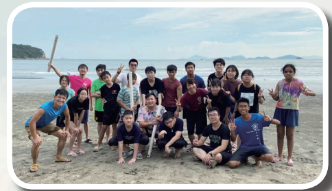
米書蘭小組福音營

米書蘭小組在1月正式成立，8月便舉行福音生活營，當中有好些未信主的新朋友。入營當日仍掛著三號風球，感謝神的眷佑，使營會順利進行，少年人能投入其中。