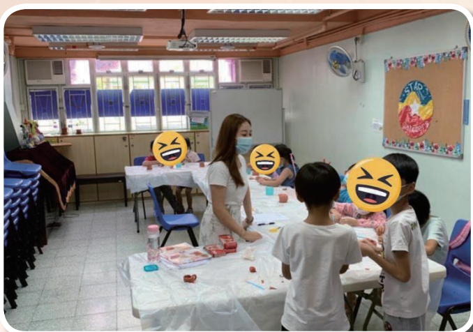
暑期活動（手工製作班）