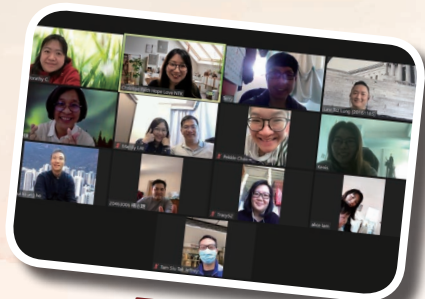
尼西團 21 周年感恩會