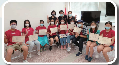
暑期青少年領袖訓練

隨著新營隊 Awana Cubbies 小熊營（幼低、幼中-3 至 5 歲）的開展，吸納了一班小朋友，以及他們的家長開始參加崇拜，願他們能夠認識神、敬拜神。