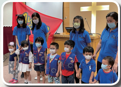
Awana Cubbies 營隊

在疫情的出路還未明朗之時，今年沙田堂憑著對主的信心，對應著年題：心意更新・合一前行，在不同的層面也作出了新嘗試。首先，年初時教會展開 Awana 的兒童及少年的事工，而且只可以以 zoom 進行，此方式確實增加了難度。此外，Awana 需要的同工人手是頗多的，但是感恩！各位導師都十分積極回應，參與其中。兒童、少年能從小便學習聖經的真理，在教會的群體中被牧養成長，對他們的生命培育是至為重要。一年過去，看見參加的兒童非常開心，中學生的投入程度也不錯。此外新來的學生也有所增加，是我們意想不到的！