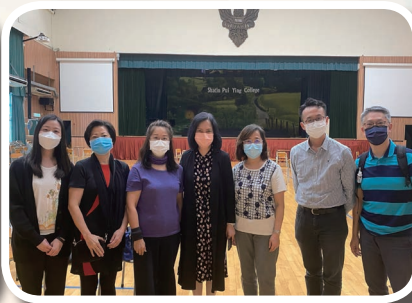
沙田堂同工與校長合照