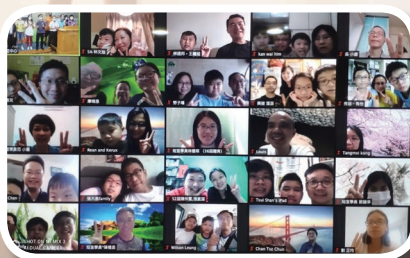
天國特工隊網上分享會