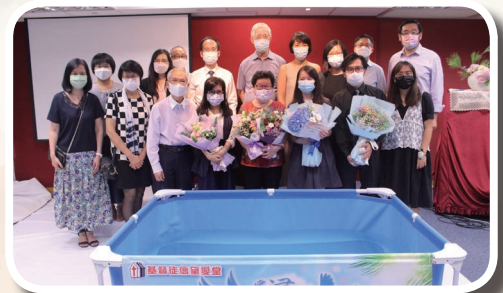
堂會 4 位肢體舉行水禮

本年度的福音工作，除了福音主日，與短宣中心合作的紅土區出隊佈道，感恩被主使用，接觸不少街坊，傾談信仰。還有與教關、扶輪社等機構合作的扶貧事工，教會肢體落力參與，藉健康講座和豐富物資祝福了 200 個基層朋友，加上電話跟進、探訪關心，部份亦開始參與教會聚會！