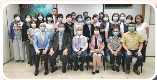
情意結 31 周年感恩會之哈拿小組