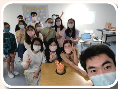
少年主日學一周年

雖然疫情仍未過去，感謝神保守肢體們身心健康。教會在 4 月陸續恢復各團組實體聚會，現在各聚會和出席人數已和疫情前分別不大。每主日肢體們精神奕奕回來參加主日聚會，聖樂部同工忠心安排每週的敬拜，讓我們可以享受豐富的屬靈筵席！