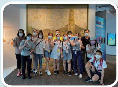
暑期信仰栽培及外出活動