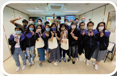
基利心團 20 周年感恩會