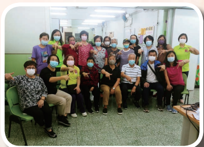
正形健膝操七周年