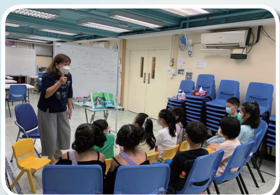
暑期活動（英語故事班）

學生參加，藉此提升社區人士對燃亮中心的認識。雖然籌備過程十分匆忙，但萬分感恩參加人數也較我們預期的理想，令人十分鼓舞。