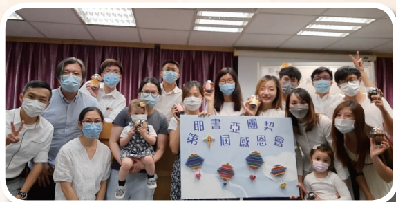
耶書亞團契十周年感恩會