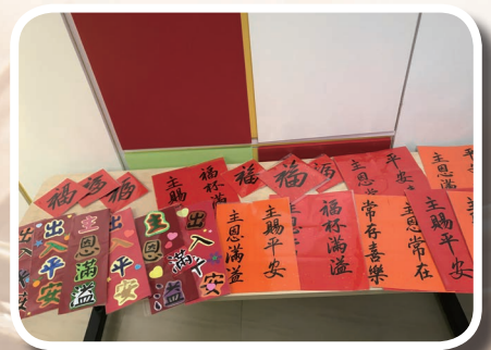
親手製作揮春送長者

其次，年初有以賽亞團肢體親手寫「福音揮春」，將主的祝福送給教會長者；有約西亞團肢體關心探訪獨居長者為他們禱告；有些長者因身體緣故未能參與實體崇拜，團友們又到訪他們家中一起網上崇拜；有一些肢體及個別團組將政府發放消費券部份金額奉獻作慈惠金，讓教會分發給有需要的人和肢體。而少年小組聚會又有不同團組哥哥姐姐與他們合團，一起玩遊戲，彼此認識，讓少年人來到教會感到被接納，感受到主的愛。肢體們的行動和分享正是對主最好獻呈，也是讓這家更美的美好見證。