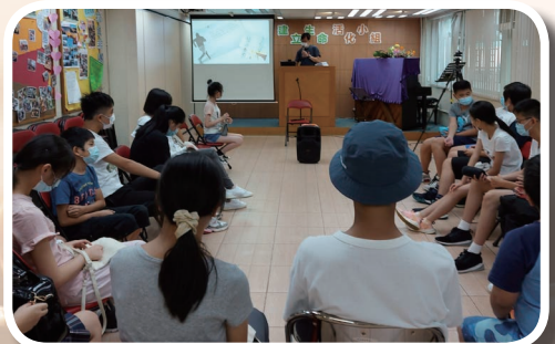
閃躍小組聚會情況

我們為社區舉辦 10 多次聚會，我們與街坊連結了，不論他們是孤單無助的長者，還是物質豐富的親子家庭，我們都彼此連結。願他們都愛返教會，日後認識神。