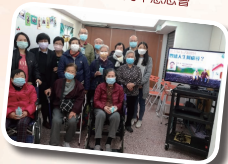
耆樂家小組長者培靈會