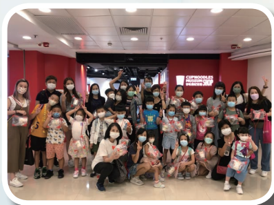
親子暑期活動 - 合味道之旅