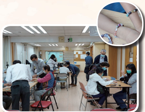
深愛小組活動 - 皮革珠繩工作坊