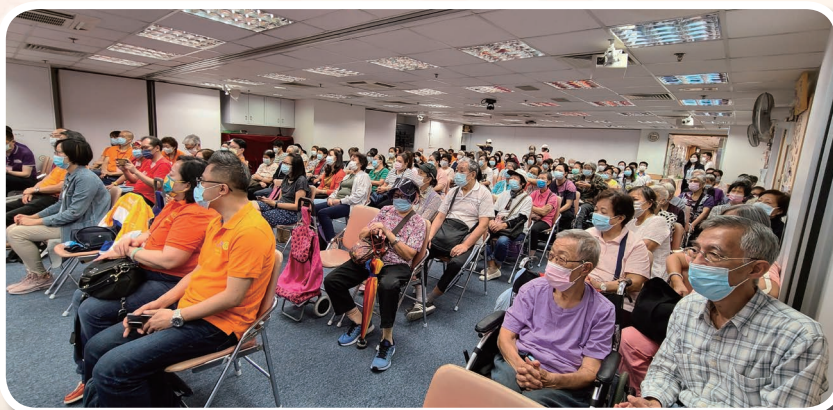
教關 1017 扶貧運動 - 「星光大道扶輪社」

「感謝神！常帥領我們在基督裡誇勝，並藉著我們在各處顯揚那因認識基督而有的香氣。」（林後 2:14）