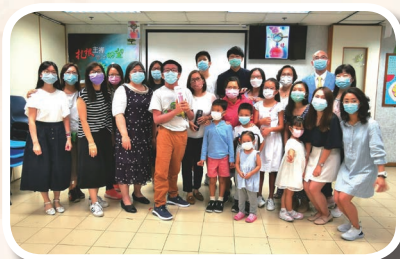
跨代兒童主日學師生合照