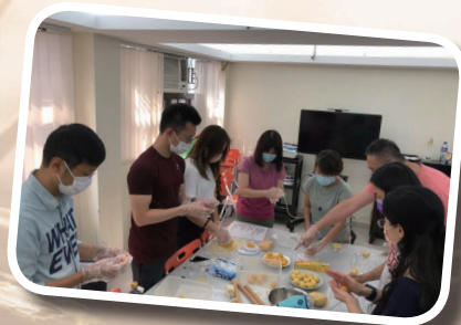
關顧部推動 中秋整月餅，探訪關懷活動