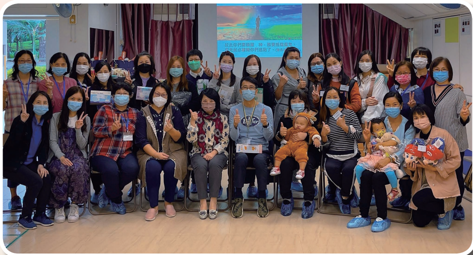
重新展開家長心靈加油站