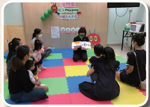
童步 play group

感恩過往屯門堂能在暑假中有不同活動栽培和牧養青少年，但更感恩在這一年的暑假期間，屯門堂開辦了兩個新的兒童暑期活動讓區內的兒童參與，分別是「童步 playgroup」以及「童心戲劇工作坊」。蒙上帝的恩典，讓教會有機會透過這種類型的活動去接觸區內的兒童和家長，而活動過後，家長們也紛紛表達欣賞，並且期望來年有機會再參與其中！除此之外，屯門堂的兒童事工亦開展了一個新的服侍—「奇妙種子」，期望能服侍一群有特殊需要的小朋友，亦與家長同行。