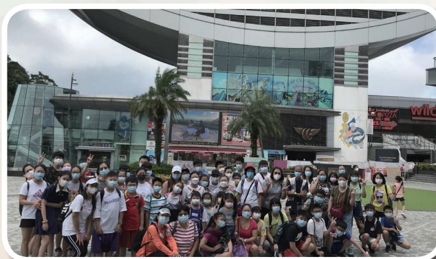
少年小組 - 山頂之旅