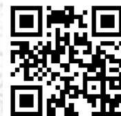
秋菊分享會報名二維碼