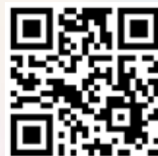
培靈會報名 QR code