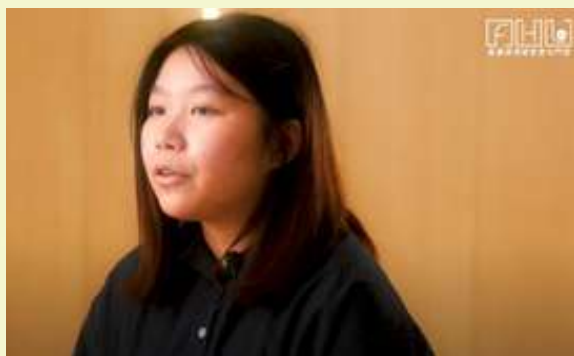
我們的見證_Kitty | 小薯仔 s