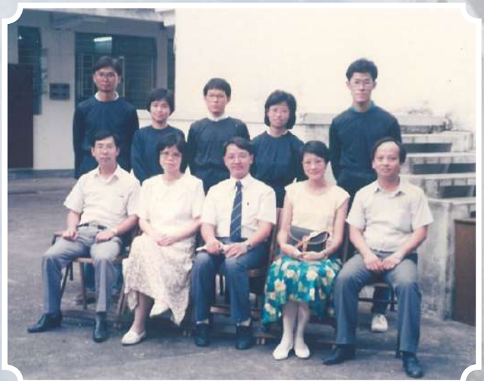
1988 年與牛頭角堂受浸肢體合照 (前排左一為筆者)

從 1964 年開始，我當時是一位中一的學生，參加了基督徒信望愛堂少年團契，後來漸漸成為團契職員，負責一些團契週性或活動，從黃大仙 R 座天台學校、南角學校，以至益豐大廈、華强大廈各處，我都是擔任一些團契職員或一些部門工作，在事奉之中，每每看見神奇的作為，雖我年少，學歷和經驗不足，但神都一一補足和教導，讓我曉得去學習謙卑，順服和依靠祂。