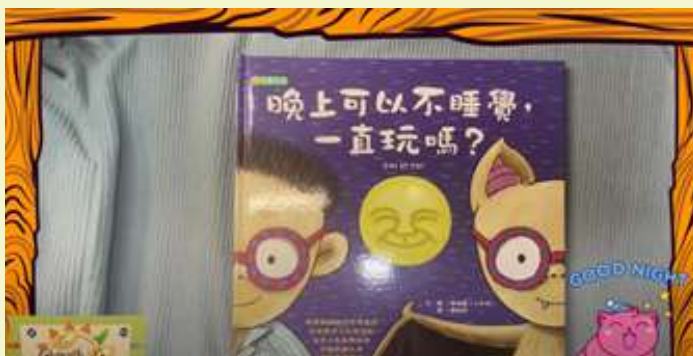
【成長園】晚上可以不睡覺，一直玩嗎？