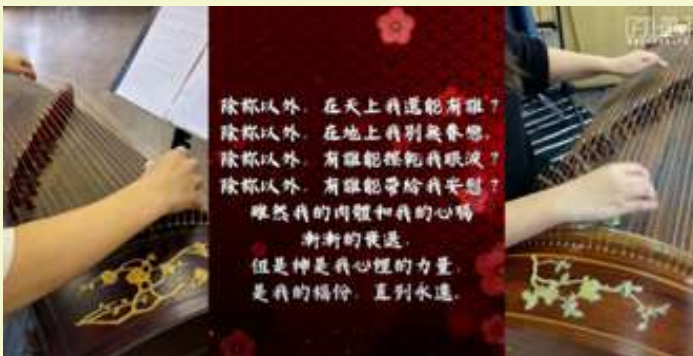
《除祢以外》cover 古箏二重奏