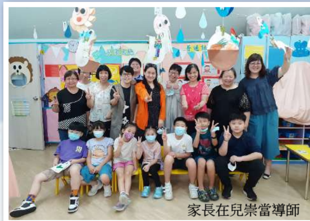
家長在兒崇當導師

學校十分著重與教會配搭、合作，故成立家長小組(教會專責小組、每周有聚會)，學校每周提供家長借書時段，教會福音同工主力跟進。在多年的努力下，統計現時在教會穩定聚會的家長和畢業生分別有 51 和 23 人，其中有 20 位家長和 10 位畢業生參與事奉，感恩更有 1 位奉獻讀神學。感謝神使用並賜福學校，成為人認識神、得著救恩的媒介，榮耀歸神！