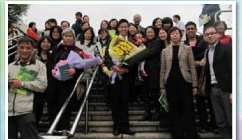
2010 年 1 月 3 日按立為執事