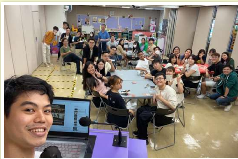
Board Game Day，有十位新朋友參與

不過值得問的問題是，玩樂與信仰就一定需要處於對立狀態嗎？筆者過去就曾經於一些課程學習過如何於桌遊中帶出信仰主題，亦嘗試於一些聚會中以熱身遊戲方式去引入信仰信息。當然如何整合，甚至以桌遊去傳福音，就仍需繼續嘗試與探索。