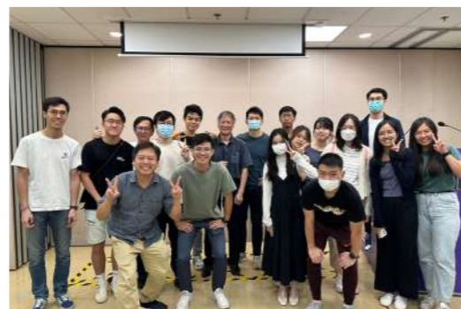
認識本區跨文化宣教

筆者曾經聽過一位傳道人分享，教會開展事工不是問「教會可以為社區做甚麼？」而是問「社區，你需要甚麼？」。雖然我們對社區或許有不同抱負與期望，但我們仍保持開放的心，探索社區不同需要。