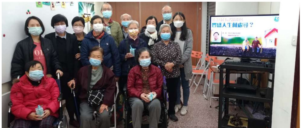
疫情中 - 耆樂家舉辦長者培靈會， 還被登上香港讀經會路上光 (2022年1-3月)