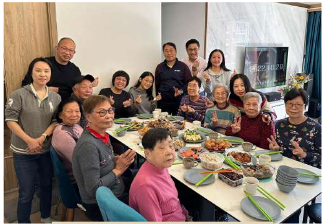
耆樂家 - 家庭聚會

我們眼見增加了長者返教會的次數，亦加強了其對牛頭角堂的歸屬感；及與其他長者交流熟絡，彼此鼓勵相顧。簡單地分享近況，代禱；談論崇拜信息的吸收與領受；唱詩；受栽培而成長。耆樂家長者的見證，生命力，愛主事主奉獻，激勵著年輕的一輩。耆樂家成立不到半年，有團友受浸。接著年日陸續有長者信主，疫情中半年裏有五位長者與家長信主；也經歷神聽禱告，他們病痛得治、難關得跨過；亦一同經歷哀傷送別團友安息主懷。這班長者一同喜樂，也同哀傷。感謝神賜福，在金齡的歲月裏，不孤單地奔天路，耆樂無比！