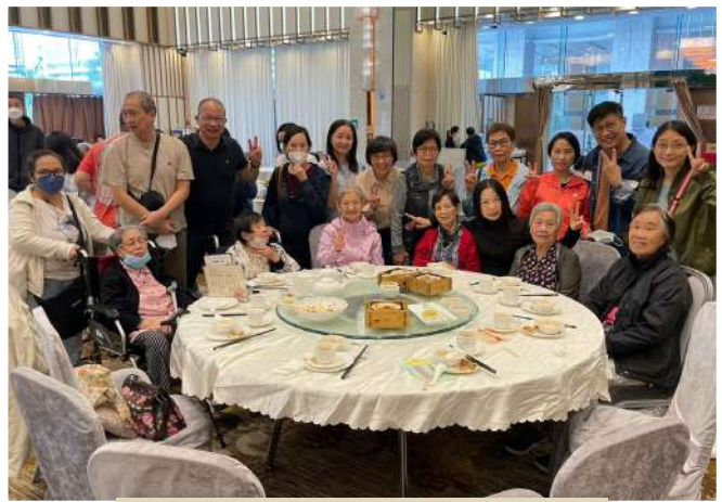
耆樂家 - 嘆茶記